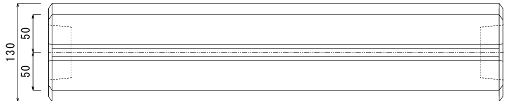
アルミレール断面詳細図 アルミアルマイトクリア加工 W3/8・M10 対応